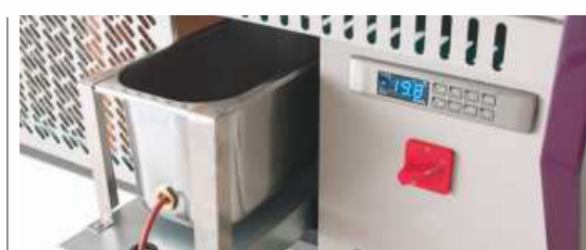
Bandeja evaporativa extraíble Removable evaporation tray