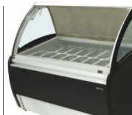
Cortina nocturna Night curtain